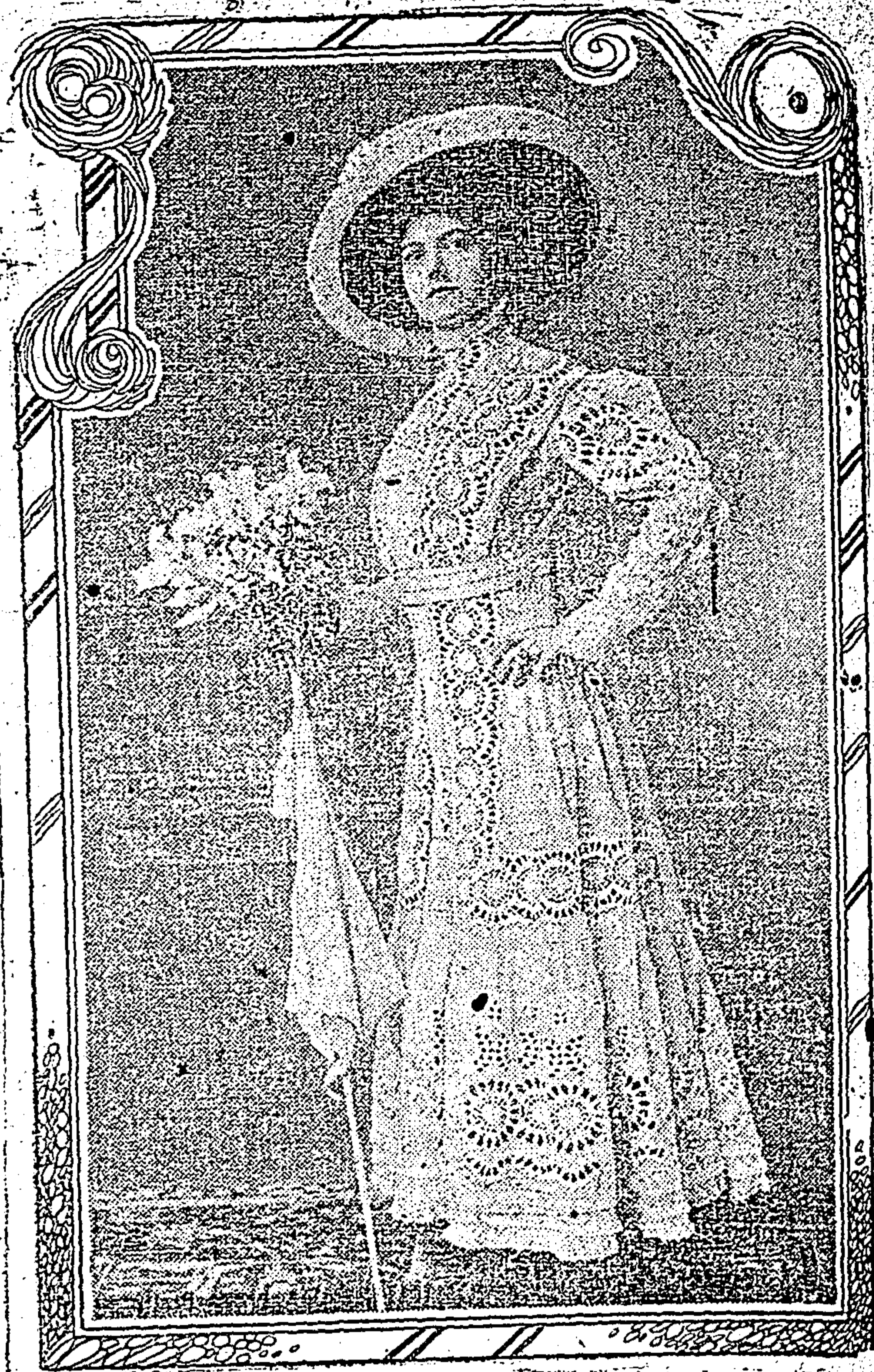
Modelo 1909, de Lino y Bordados.