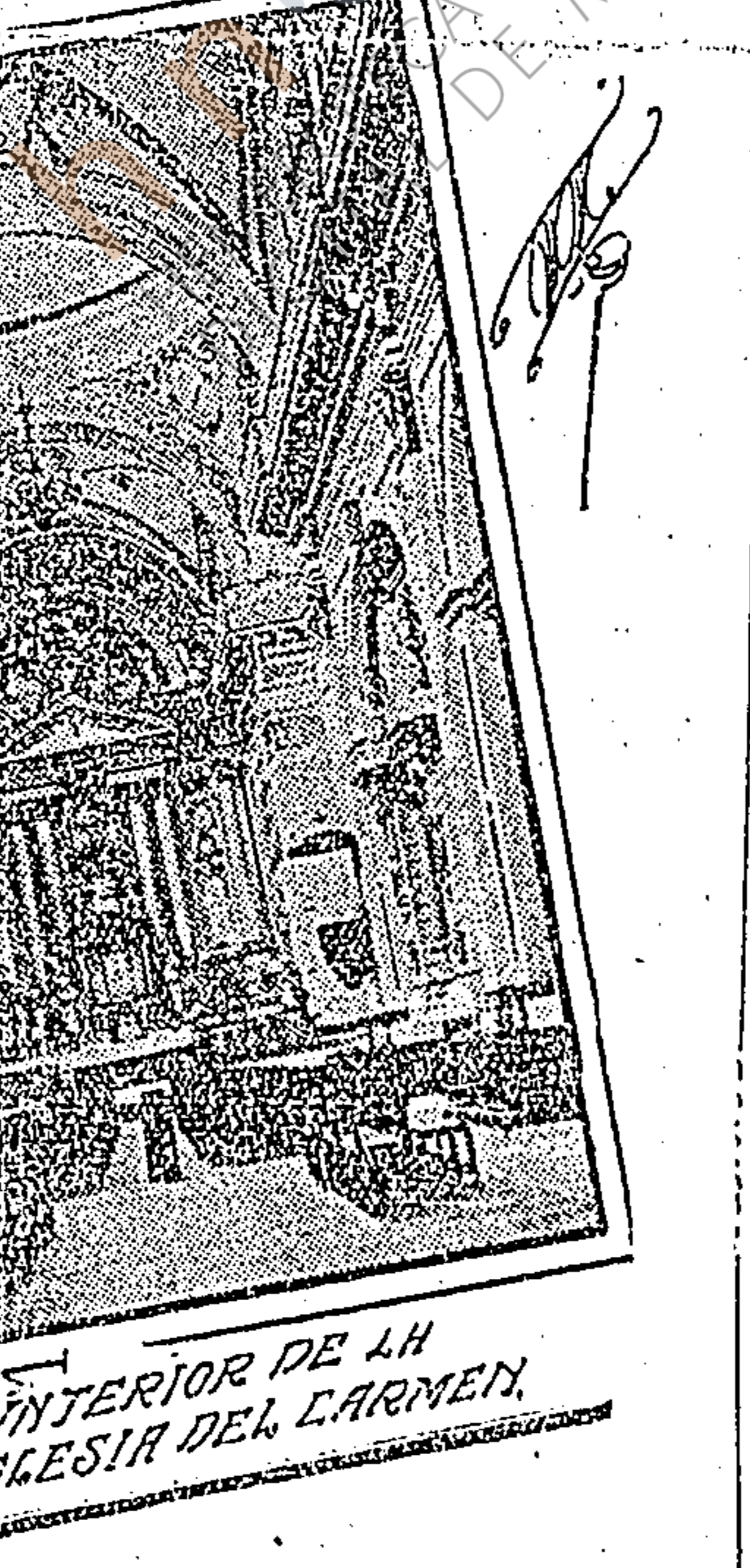
INTERIOR DE LA IGLESIA DEL CARMEN