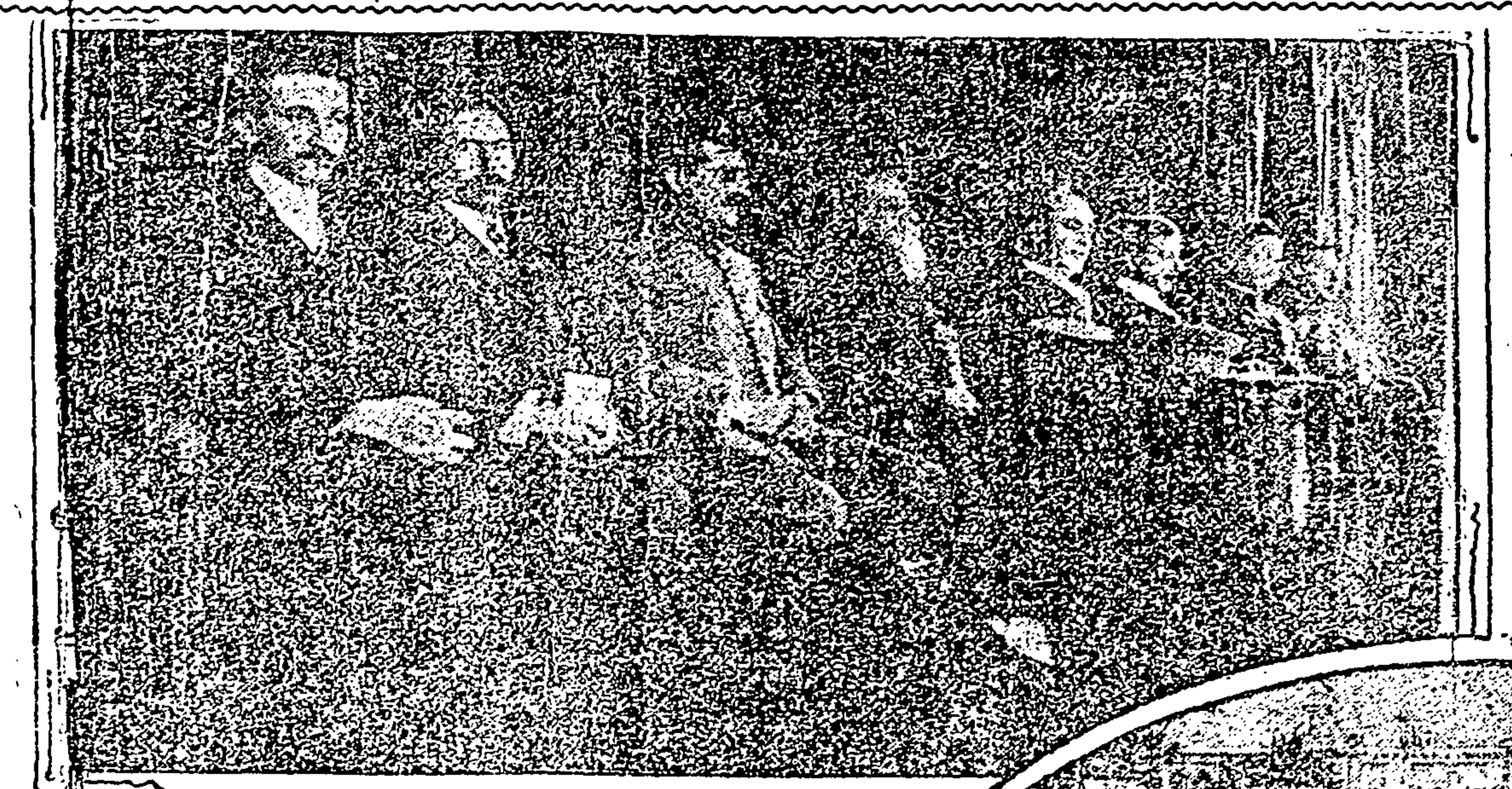
CHAPULTEPEC. EL SR. CARRANZA, PRESIDIENDO EL ACTO OFICIAL.