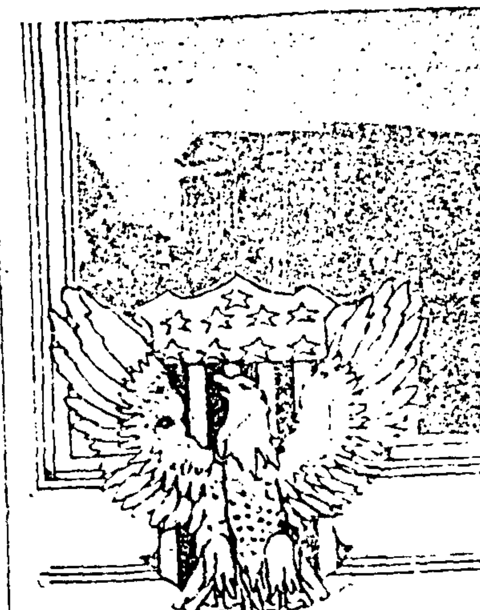
EL CAPITULO DE WASHINGTON