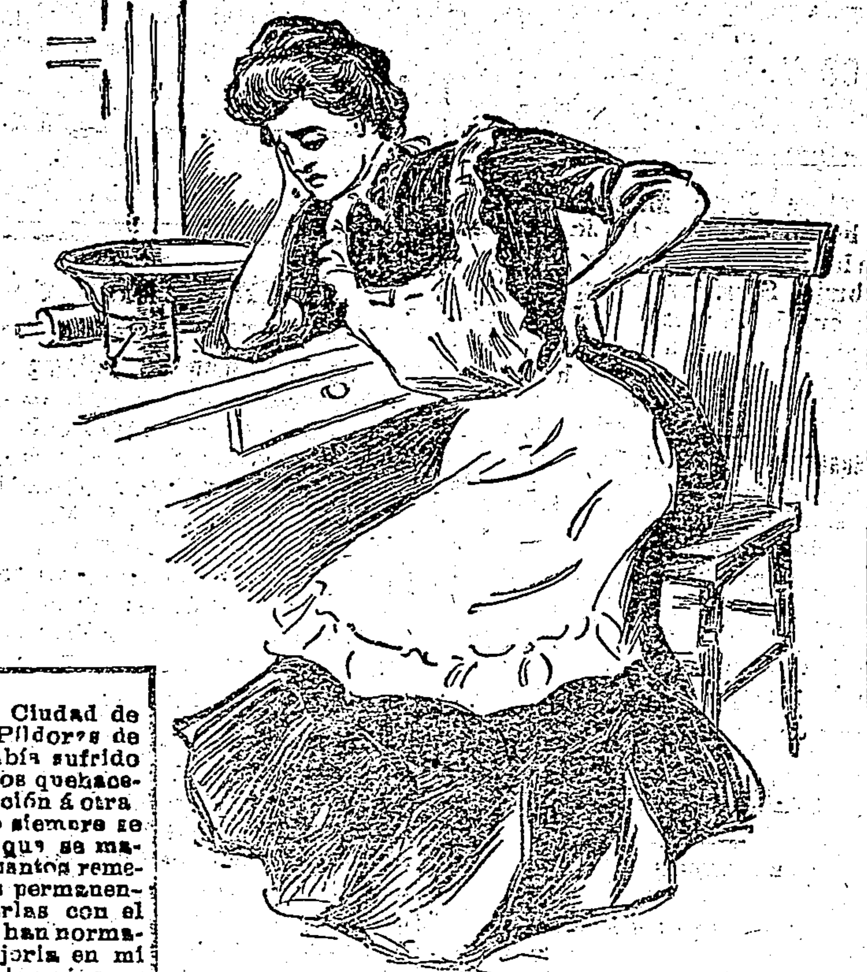
De venta en todas las Farmacias y Droguerías. Foster-McClellan Co., Buffalo, N. Y., E. U. de A.