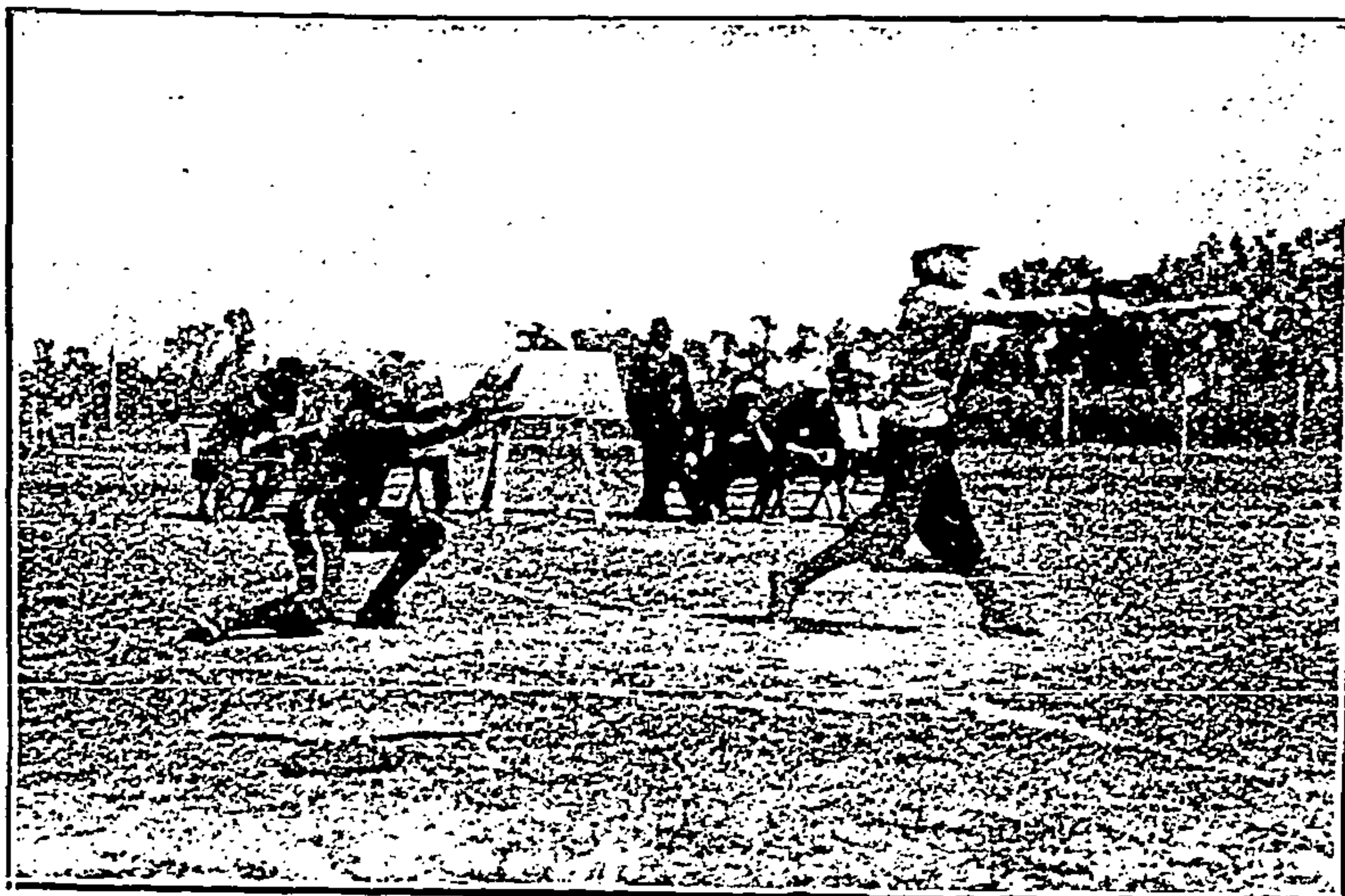
Un bateador yerra el golpe.

Hace aproximadamente nueve años que un grupo esforzado de jóvenes aficionados al «sport» idearon establecer una temporada de juegos de pelota al aire libre (base-ball) y, para ello, organizaron «teams» y en un terreno inmediato á la calzada de la Reforma armaron su campamento para disputarse el triunfo domingo á domingo. La idea fué ganando terreno y no tardó en establecerse un campeonato, que llegó á despertar entusiasmo entre los afectos al saludable ejercicio deportivo. En 1905 el entusiasmo llegó á su más alto grado; los principales periódicos trataron de dar gran impulso al desarrollo del «sport» en México, medida salvadora para nuestra raza; se levantó un parque en la Reforma; «El Imparcial» ofreció una hermosa copa de plata como trofeo para el vencedor, y ese invierno el campeonato de pelota hizo época en los anales de México, pues se jugaron partidos mejores que en muchas ciudades americanas.