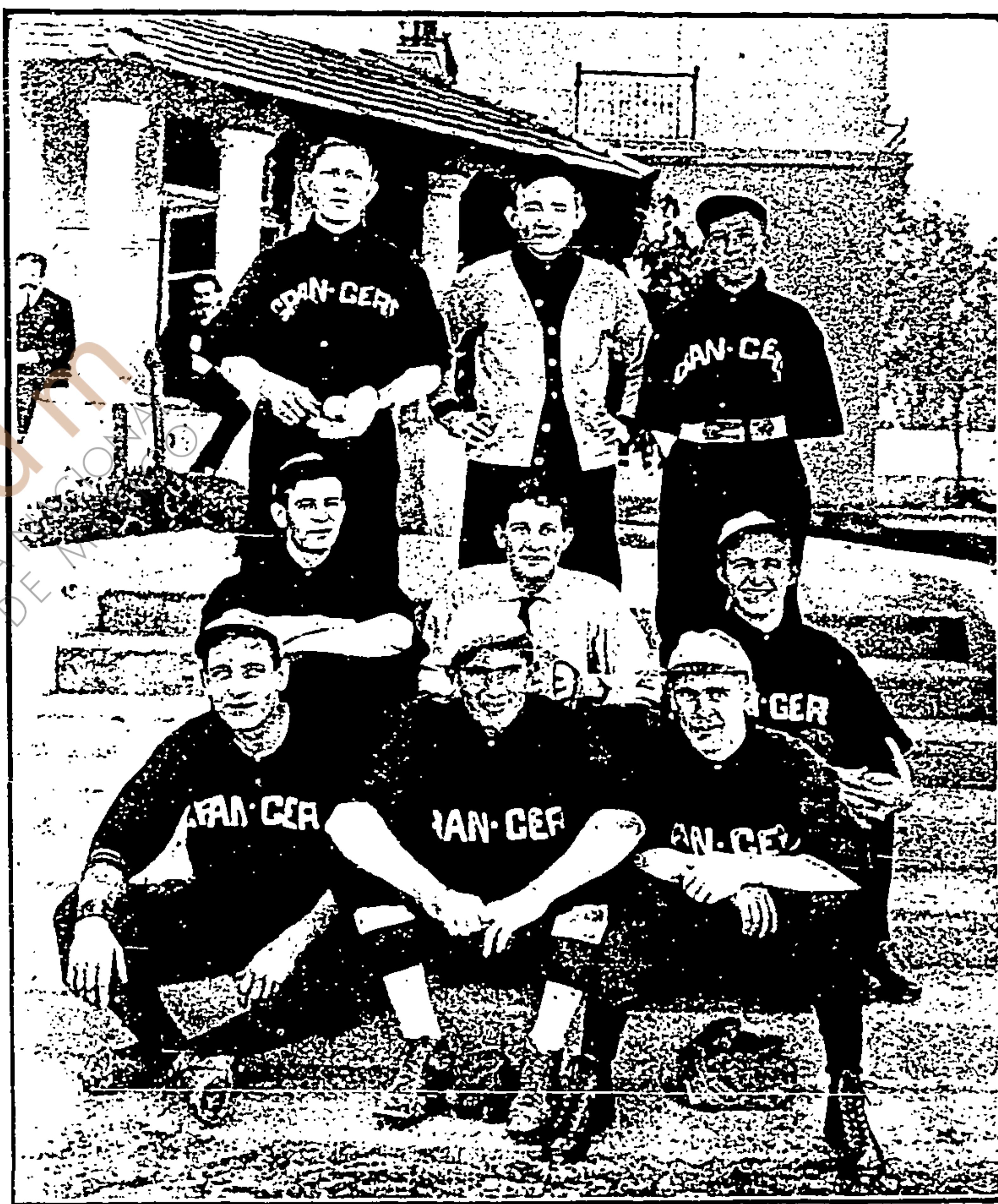
La novena «Granger» en el «Country Club»