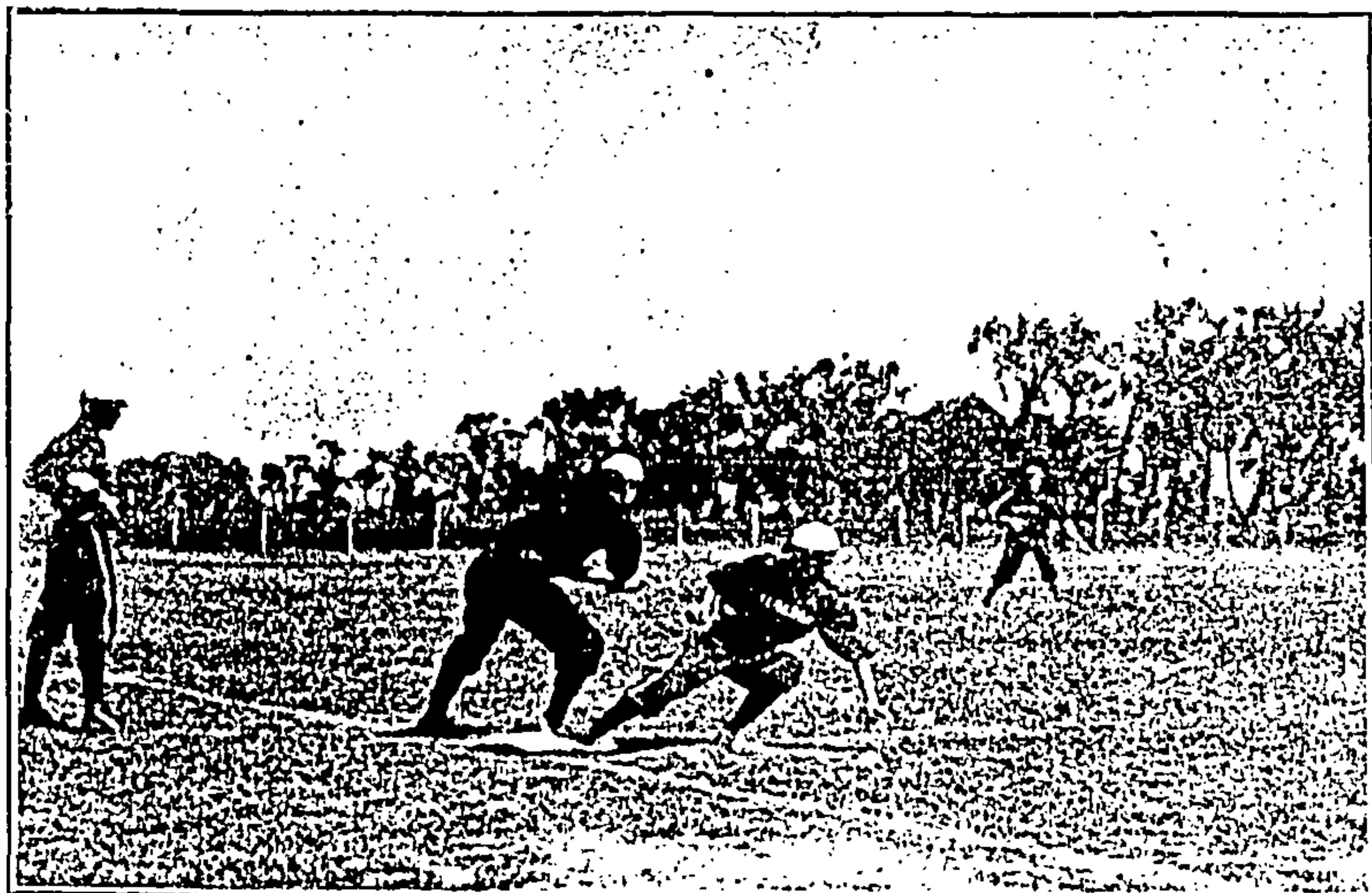
Una tirada á primera base.