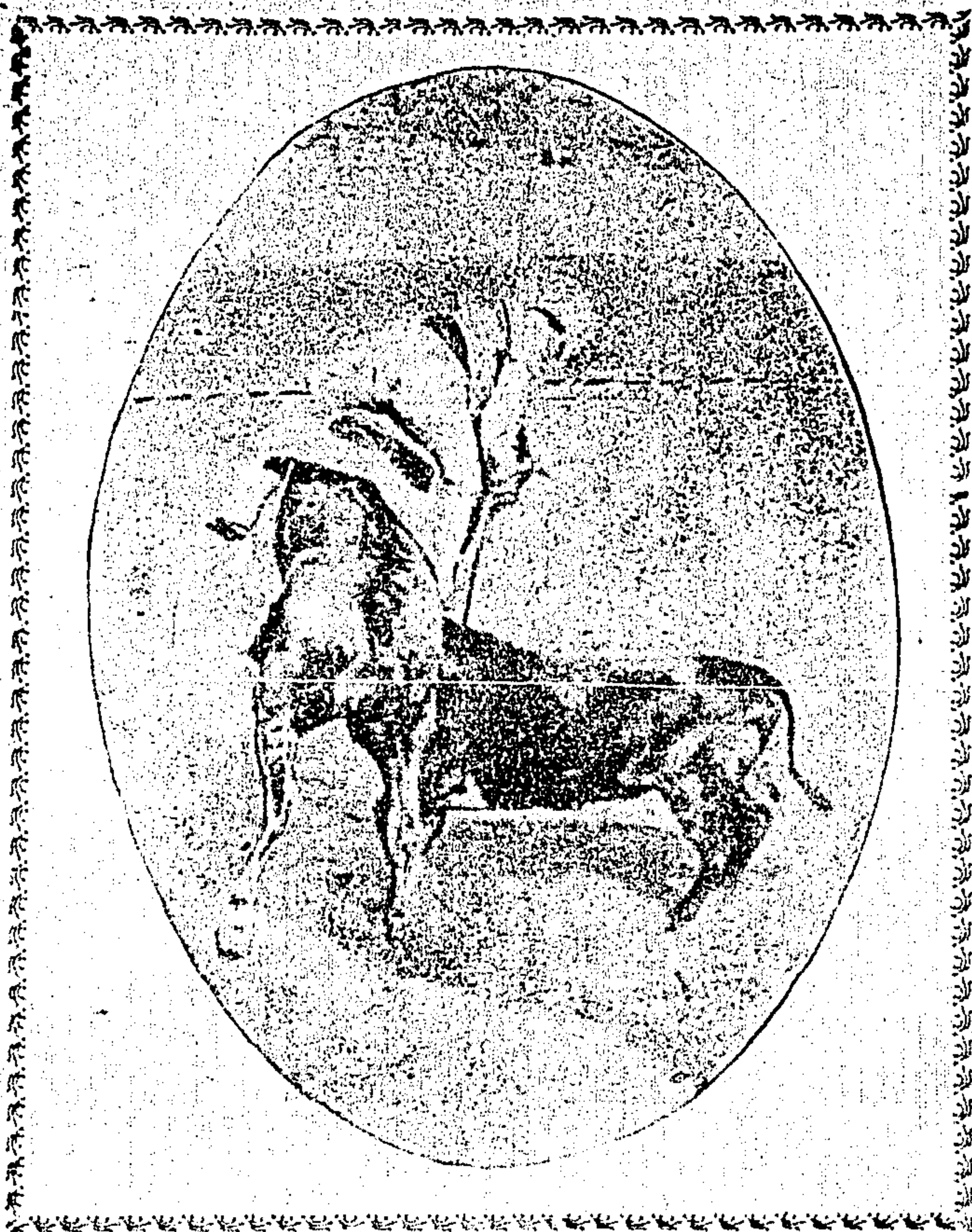
"Pepe Largo" en el 4o. toro.

El gusto se ha refinado á fuerza de ver desfilar toreros y más toreros, y de la observación constante y celda-