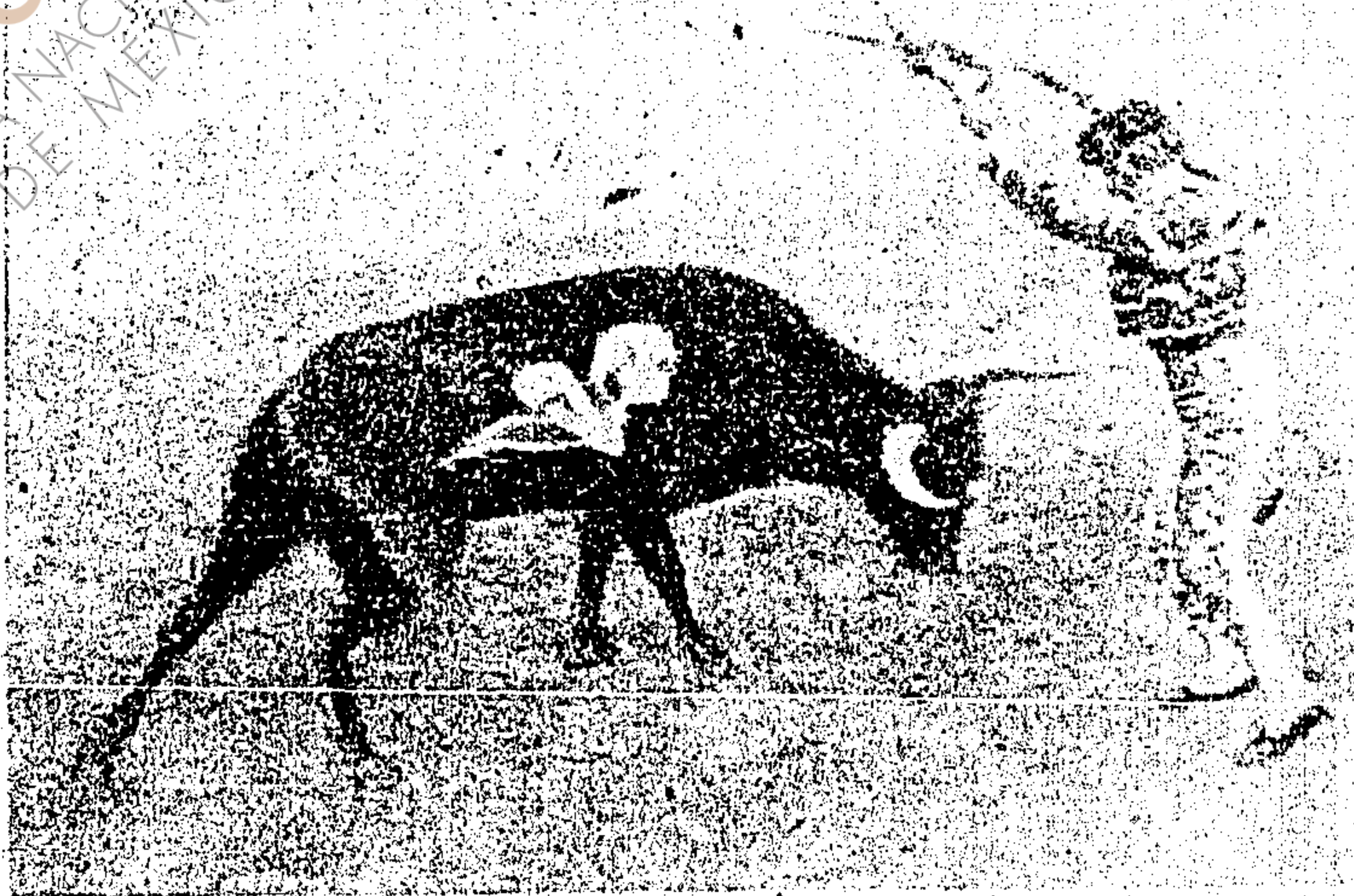
"Parrao" en un cambio sin clavar los rehiletos.

dosa, lleno que resultar el conocimiento firme, la apreciación exacta de lo que entraña en sí mismo el espectáculo de reses bravas.