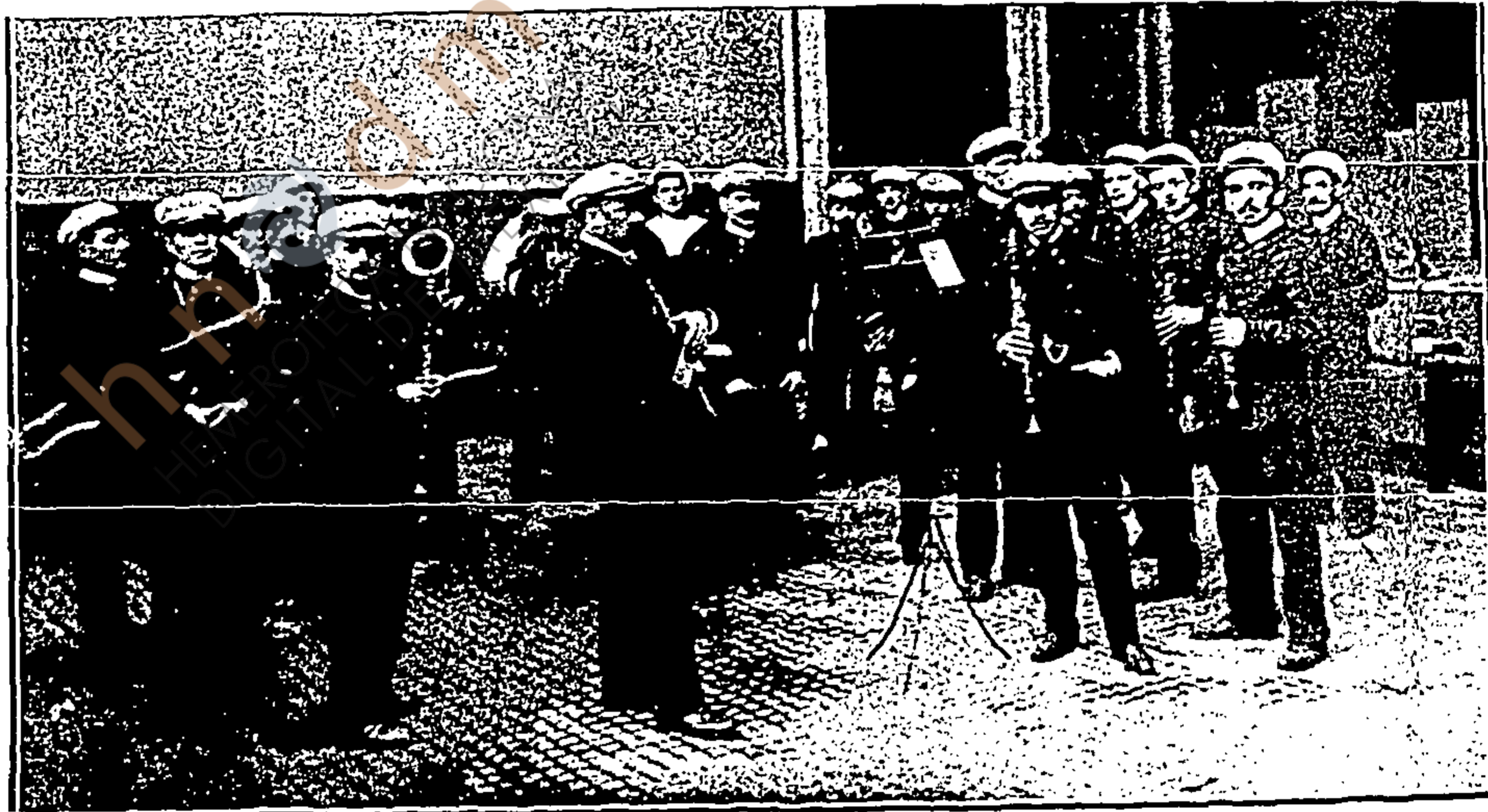
Banda del "Kleber."

Por último, los marinos vieron los salones de enajillado y de empaque, también muy notables por el gran número de empleados con que cuentan y por su organización.