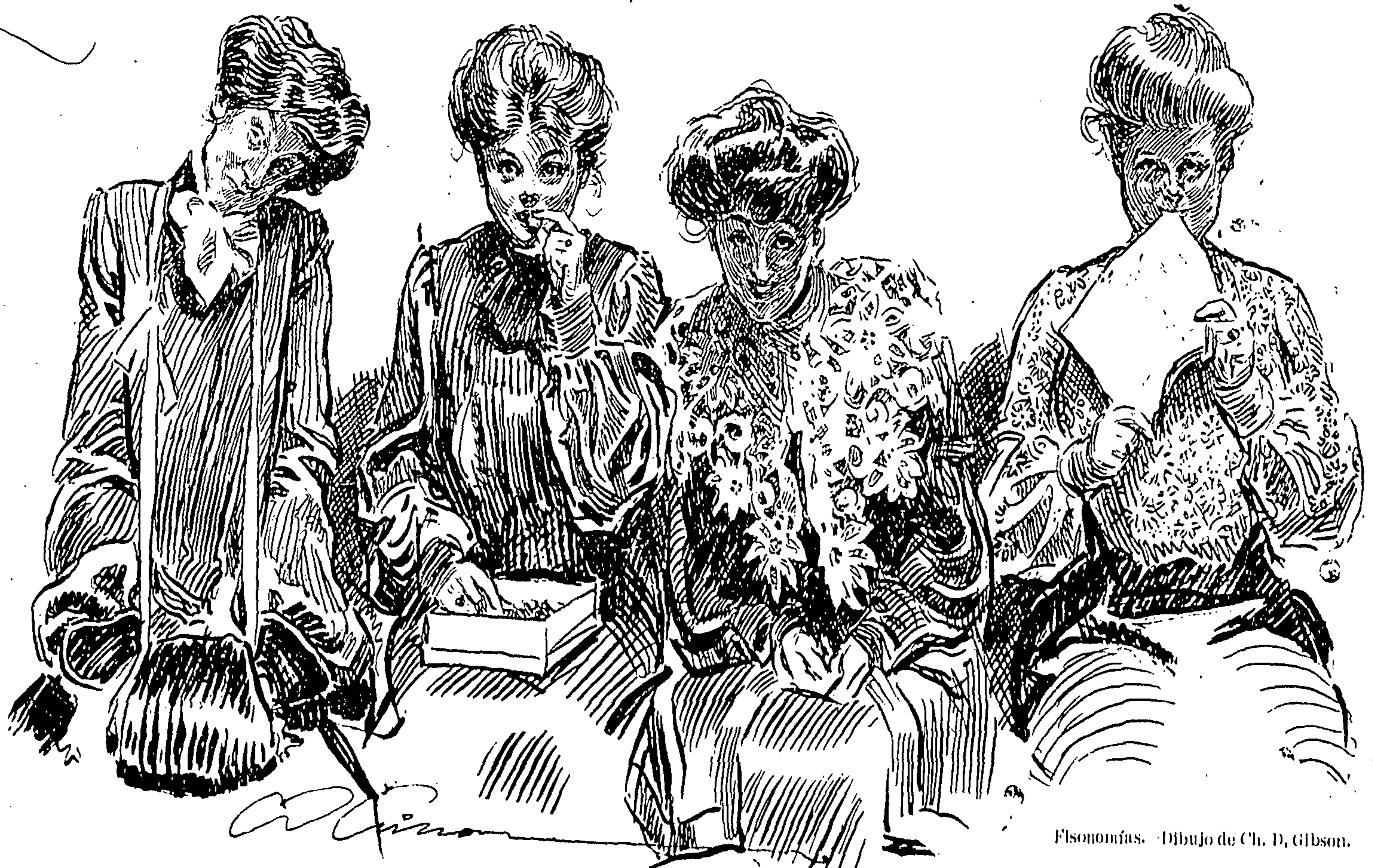
Elsonomías. Dibujo de Ch. D. Gibson.