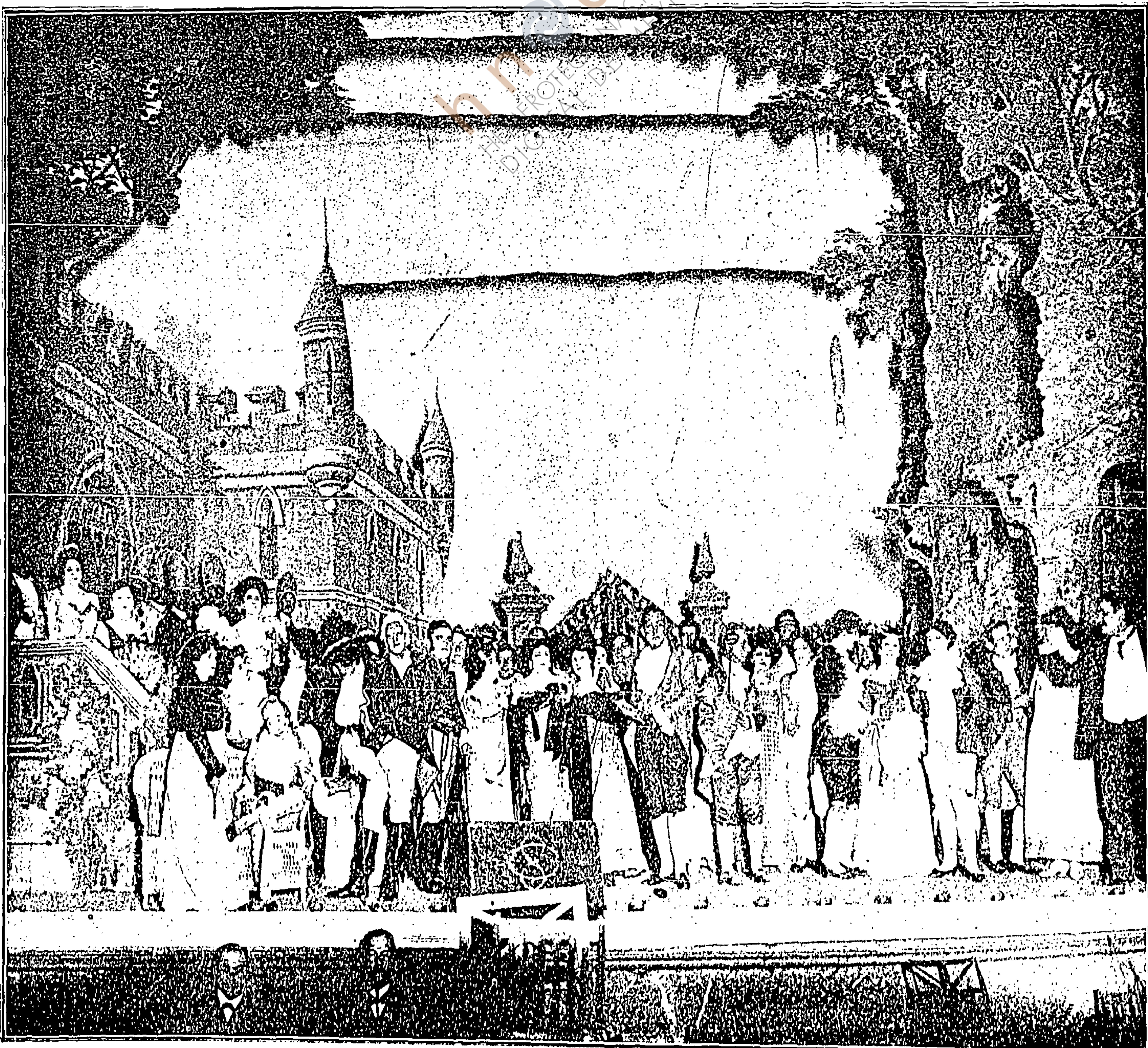
TEATRO ARBEU.—PERSONAJES DE "LOS SALTIMBANQUIS"