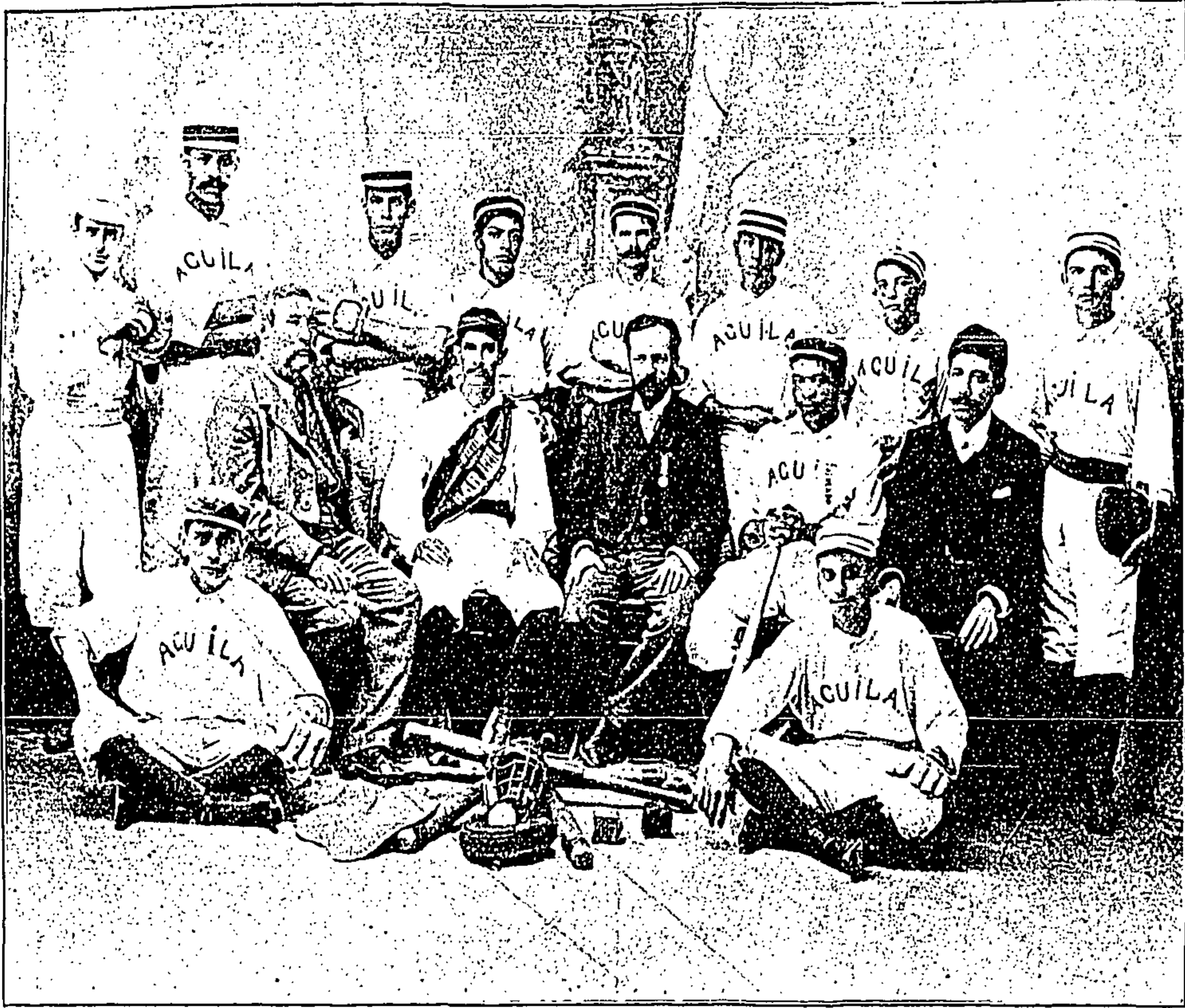
VERACRUZ.—GRUPO DE SOCIOS DEL «CLUB AGUILA.»

El ídolo referido permaneció expuesto durante algún tiempo en la Biblioteca Pública de Cuernavaca, de donde fué enviado á cambio de algunas publicaciones, al Museo.