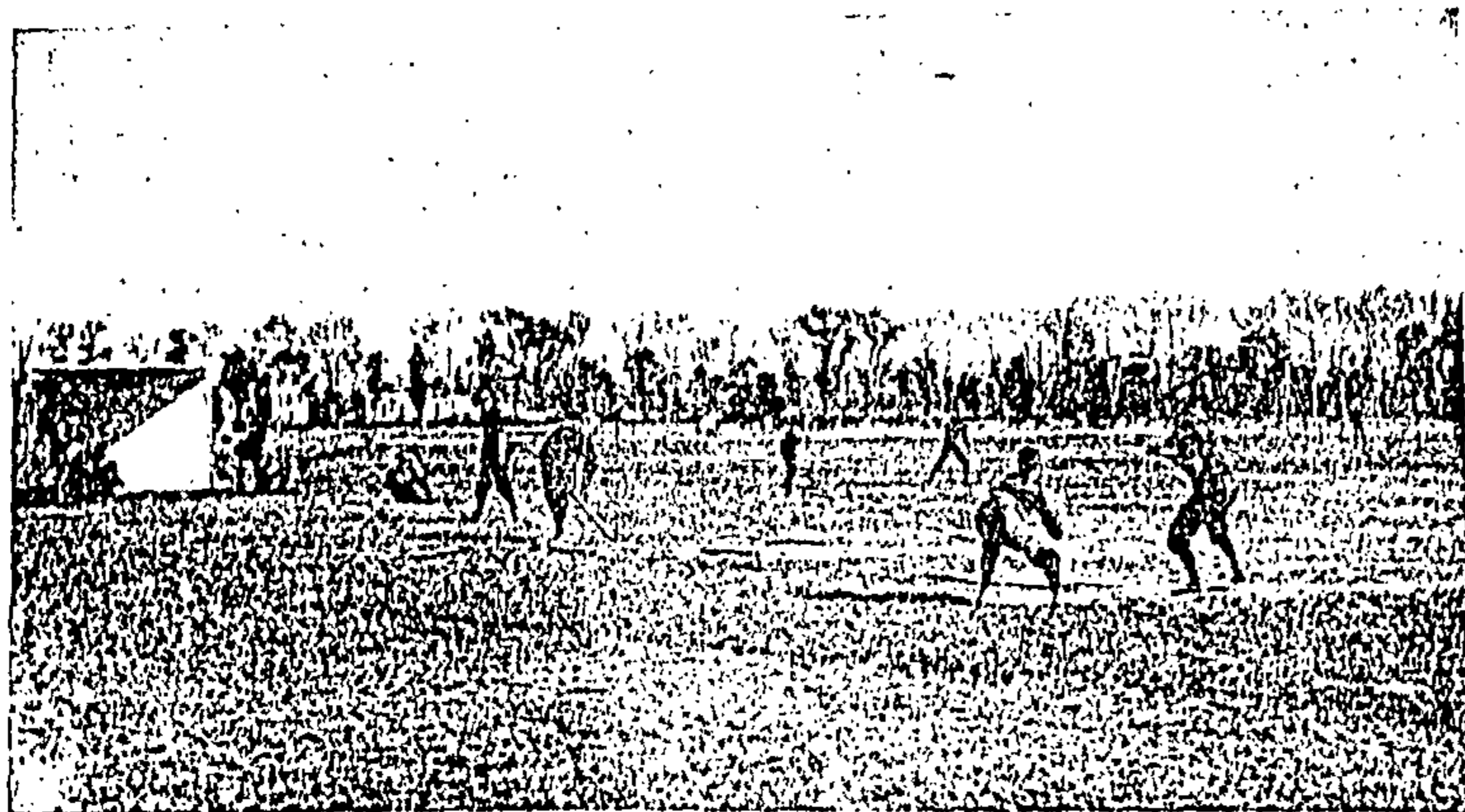
Esperando la pelota.

Nuestros grabados representan, uno la disposición general de los jugadores; otro la disposición del pitcher, catcher y batter; y otro el momento en que un jugador del Club México va á tomar la primera base, después de haber dado un soberbio golpe de "bat;" mientras otro va á pasar de la segunda á la tercera base.