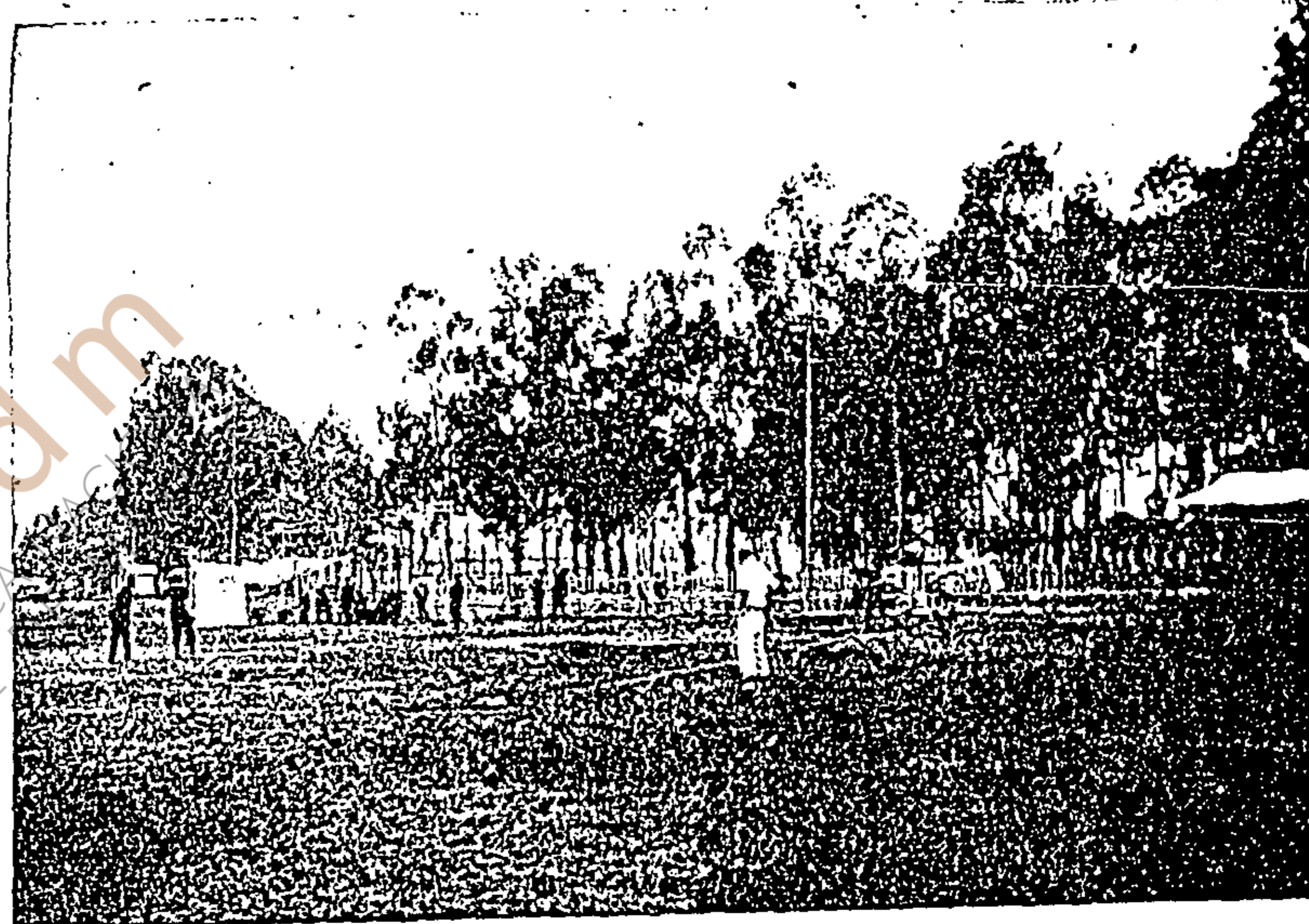
Al comenzar una entrada.