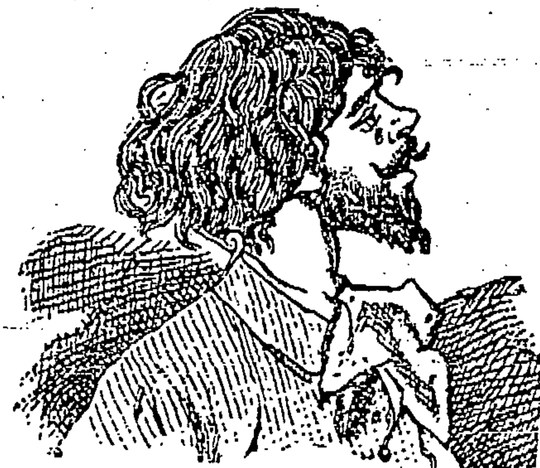
VIVE DE ILUSIONES.