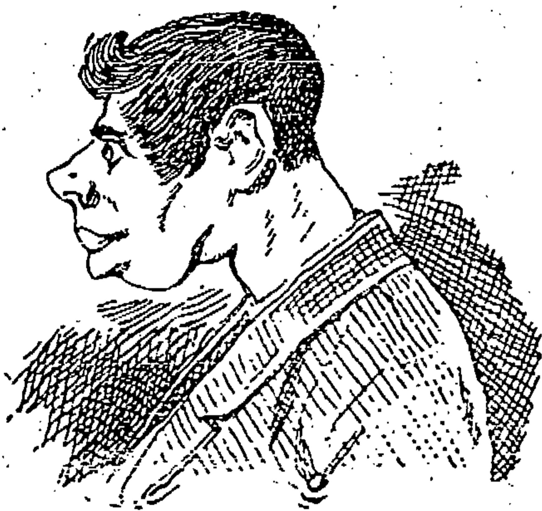
VIVE DE SU TRABAJO.