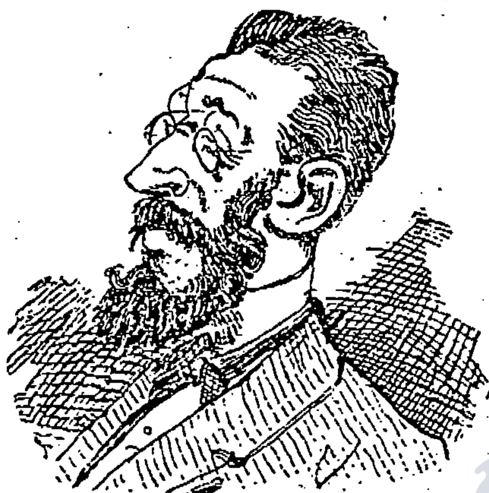
VIVE DE SUS RENTAS.