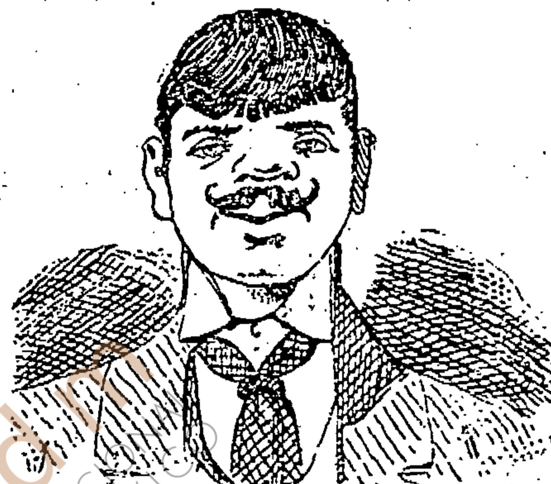
VIVE DE RENTAS.... DE SU MUJER.