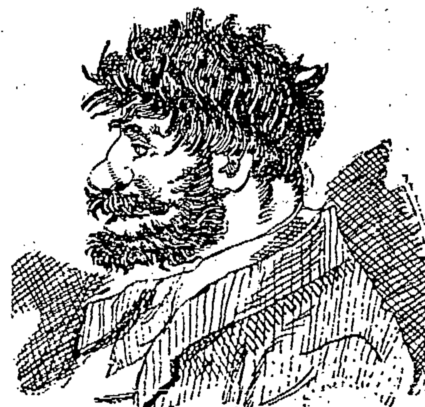
VIVE DE LA TOLERANCIA DEL GOBIERNO DEL DISTRITO.