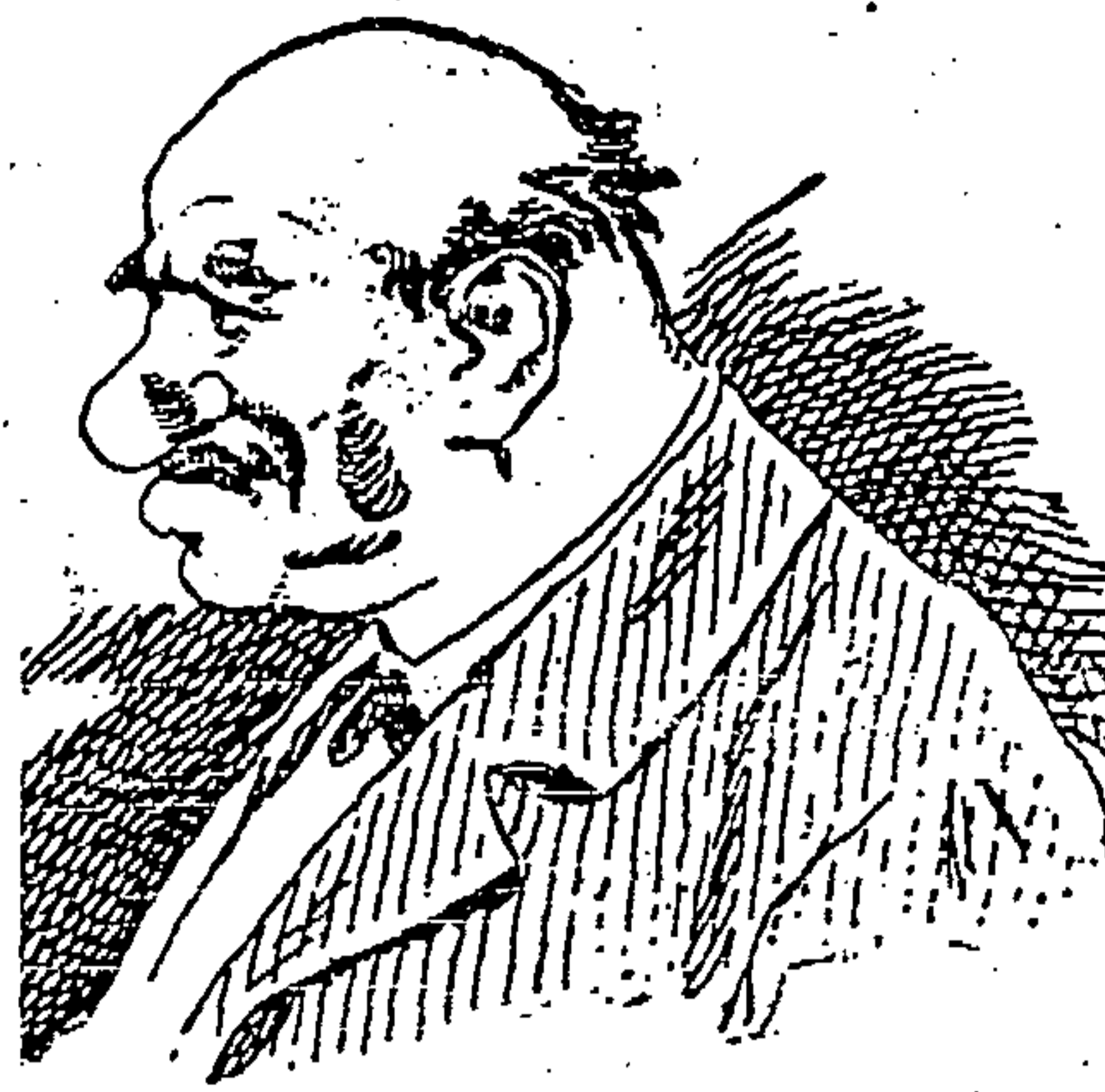
VIVE DEL TRABAJO.... DE LOS DEMÁS.