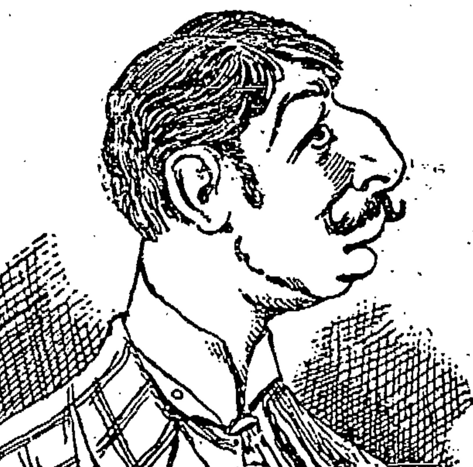
VIVE DE LO QUE CAIGA.