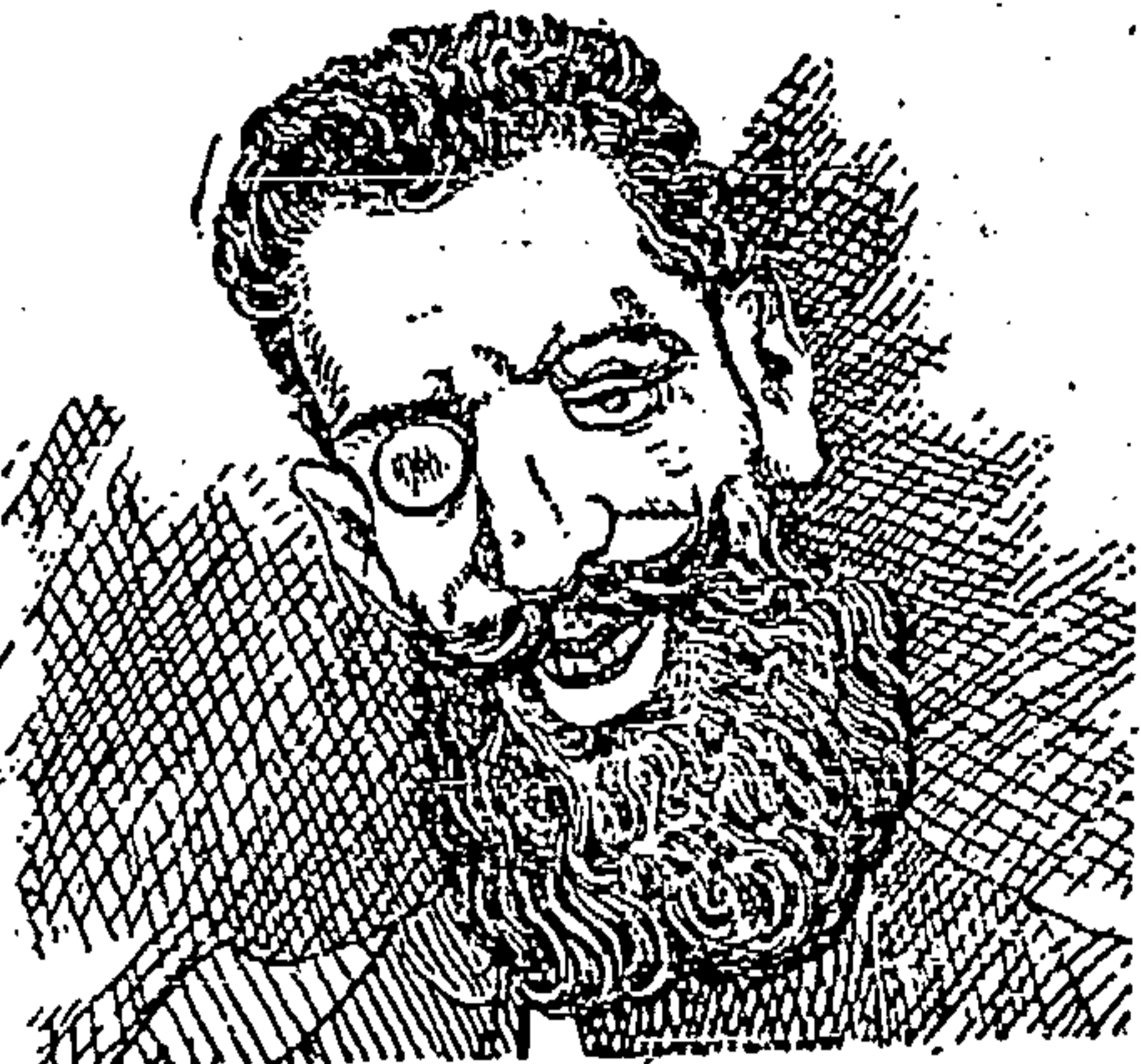
NO SE SABE DE LO QUE VIVE.