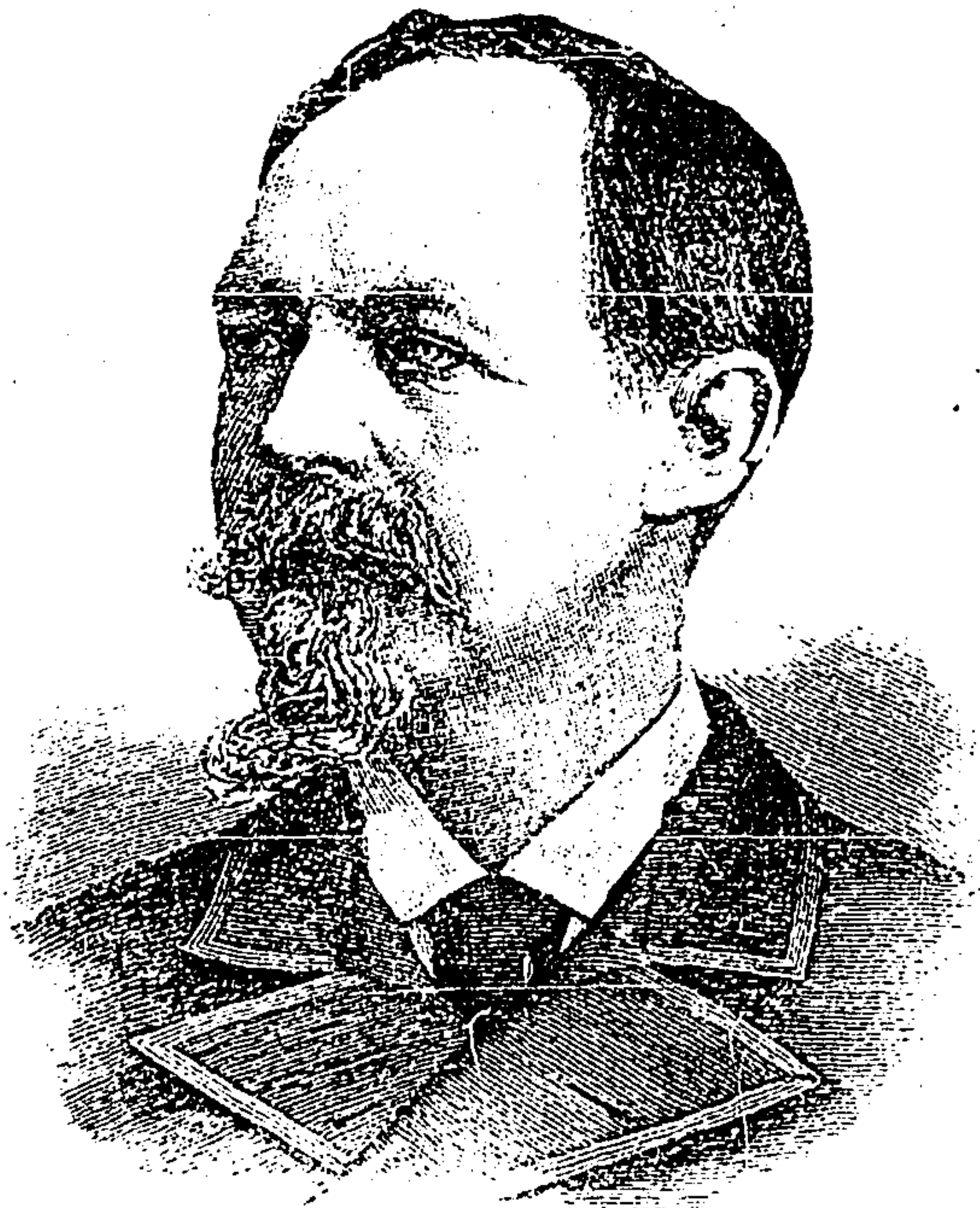
S. A. R. LUIS FELIPE ALBERTO, Comte de Paris .