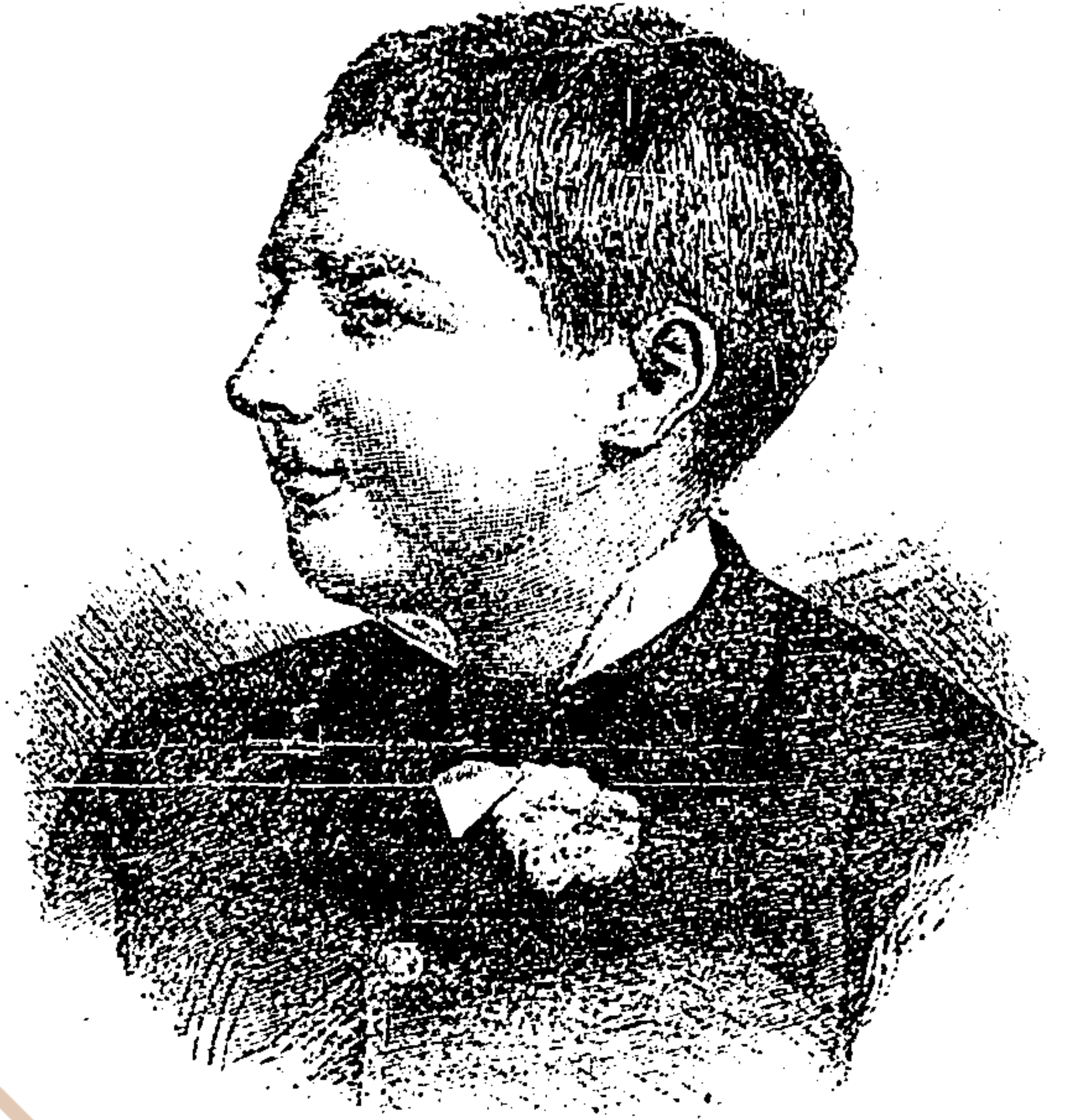
S. A. R. LUIS FELIPE ROBERTO, Duque de Orleans

h n a d m HEMEROTECA NACIONAL DIGITAL DE MEXICO