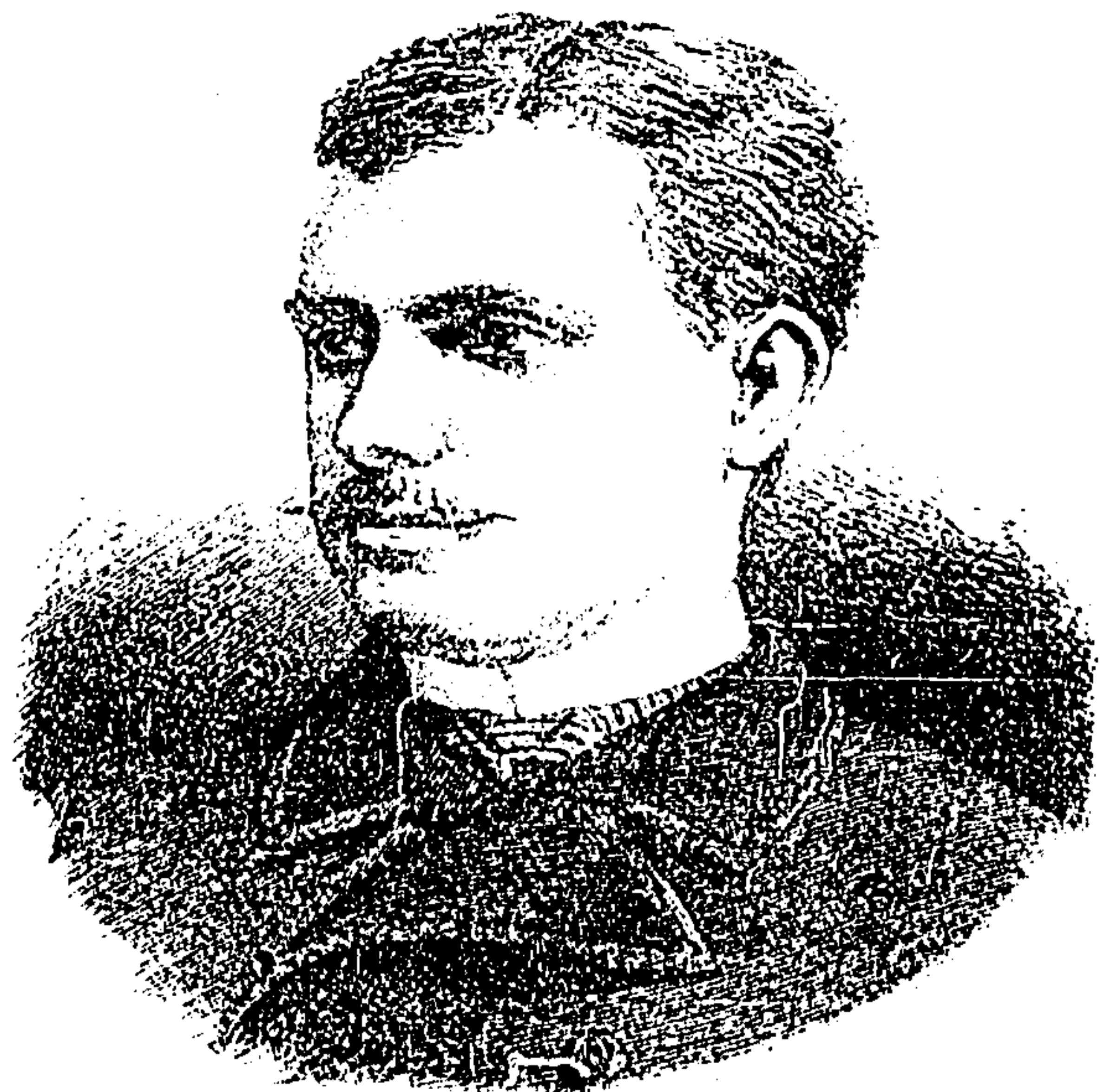
S. A. I. NAPOLEON VICTOR BONAPARTE